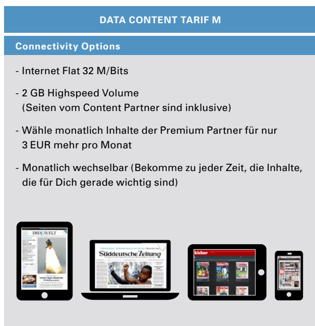
Abbildung 8: Beispielhafte Value Proposition

Auf Basis der entwickelten Business Model Canvas kann ein Beispiel für eine Value Proposition/Produkt wie folgt aussehen: