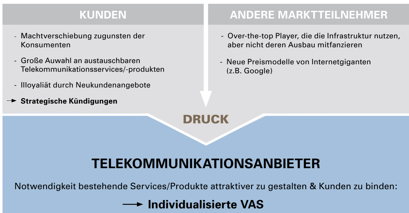
Abbildung 1: Problemstellung – Commoditisierung der Telekommunikationsbranche

Eine Individualisierung funktioniert jedoch nur auf Basis detaillierter Kundenkenntnis. Telekommunikationsunternehmen haben durch ihre jahrelange CRM Erfahrung und der Implementierung von Prognosemodellen wie Next Best Activity (NBA)/ Next Best Offer (NBO) bereits heute einen großen Erfahrungsschatz in der Individualisierung von Angeboten. Damit sind also beste Voraussetzungen vorhanden, um individualisierte VAS zu entwickeln, statt nur die Rolle eines Infrastruktur- oder Distributionspartners einzunehmen.